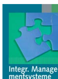
Integr. Manage- mentsysteme